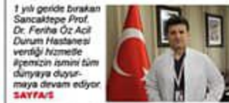
1 yılı geride bırakan Sancaktepe Prof. Dr. Feriha Öz Acil Durum Hastanesi verdiği hizmetle ilçenin ismini tüm dünyaya duyurmuş olmasına katkı sağlıyor. SAYFA 5