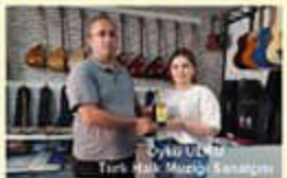
BYKULUN Türk Halk Müziği Sanatçısı