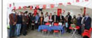
Sancaktepe Kaymakamlığı ve Türk Kıızılay'ı ile birlikte düzenlediği "Kan Bağışı" kampanyası yaptı. SAYFA 2