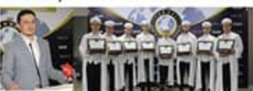
Millî ve manevî değerlere bağlı, şuurlu, milletini seven, genç yetiştirme hedefinde olan Darü'l Erkam Derneği ilki hafızları icazetlerini aldı. SAYFA 2