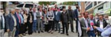
Yuvayı Ağırbaşlılığını Katarlı ile Sancaktepe'de Esnaf ve STK ziyareti yapan İyî Parti Sancaktepe İlçe Başkanlığı vatandaşların sorunlarını yerinde dinleyip talep ve şikayetlerini aldı. SAYFA 8