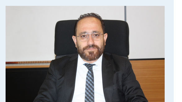
KOSGEB 'DE MİKRO VE KÜÇÜK İŞLETMELER İÇİN SÜRE UZATILDI HABERİ 05'DE