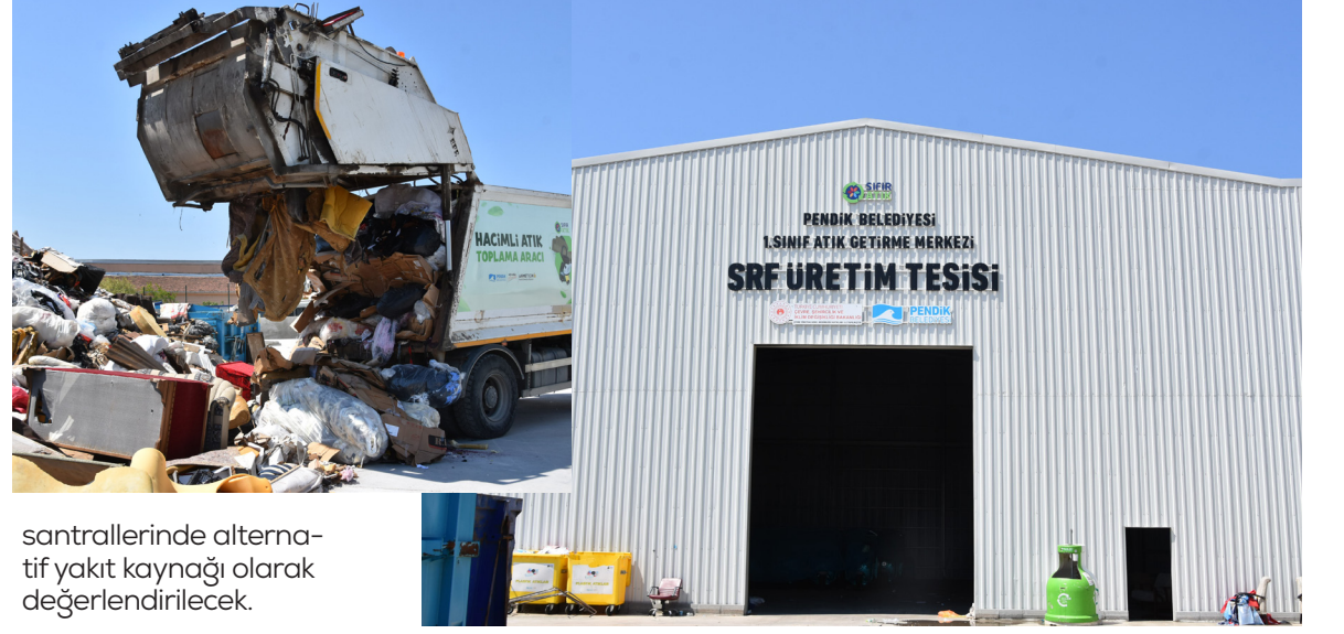
santrallerinde alternatif yakıt kaynağı olarak değerlendirilecek.

Merkezde ahşap atıkları, tekstil ürünleri ve hacimli atıklardan elde edilen materyaller geri kazanım tesislerine yeniden ham madde üretilmek üzere geri dönüşüm tesislerine gönderilecek. Ahşap, sünger ve tekstil grubu ürünlerden geriye kalan atıklar ise parçalanarak biokütle halinde enerji