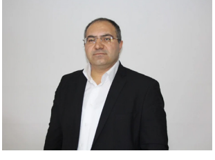
SAVAŞ SONGUR ARŞİV UZMANI TARİHÇİ

Niyazi Yıldırım Gençosmanoğlu'nun mehter marşı şeklinde söylenen muhteşem şirinde de ifade edildiği gibi aylardan ağustos ise Türk'ün zafer ayındasınız.