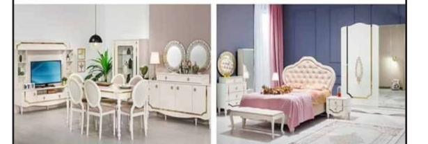
Fabrika Üreticilerinden Halka Toptan Fiyatına Pazarlık Satış

SANMOT MOBİLYACILAR ÇARŞISI SANCAKTEPE İSTANBUL