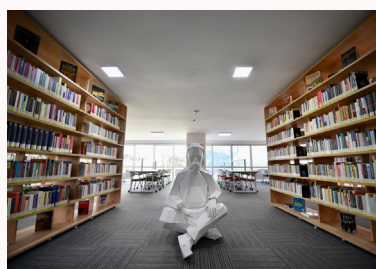
SANCAKTEPE'YE BİR KÜTÜPHANEDE İBB'DEN HABERİ 04 DE

SANMOT MOBİLYACILAR ÇARŞISI SANCAKTEPE İSTANBUL