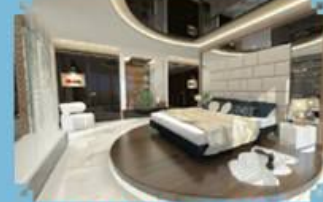
PAPRIKA, ÖZEL TASARIM YATAK ODASI