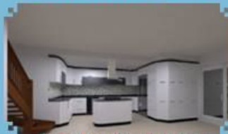
PAPRIKA, ÖZEL TASARIM MUTFAKYO