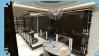
PAPRIKA, ÖZEL TASARIM BANYO

www.paprikayapi.com info@paprikayapi.com