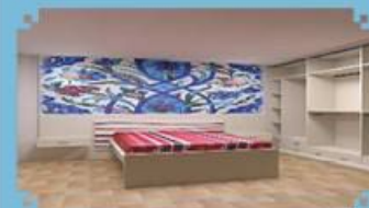
PAPRIKA, ÖZEL TASARIM YATAK ODASI