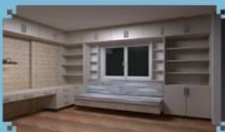
PAPRIKA, ÖZEL TASARIM ÇALIŞMA ODASI