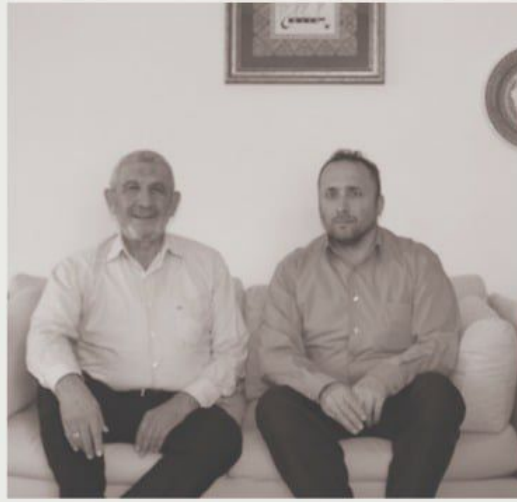
deki kahramanlar gibi zaferi kazandı.

Askerlerimiz önce 18 Mart 1915 büyük Deniz Zaferini kazandı. Üç devlet İngiliz, Fransa ve Rusya ait 20 ye Yakın gemileri vardı. Ateş üstünlüğü tamamen o gemilerdeydi. Enfal süresi 17. Ayeti kermesinde olduğu gibi Allah (cc.) öyle rast getirdi ki dümeni vurdurdu Seyit Onbaşı, onların gozunu kulağını Allah (cc.) öyle etti ki bizim Nüsret mayın gemimizin doğması olduğu 26 adet mayınları gördükler. Mayınları suyun 3 metre altında idiler. Uçakları bir ay boyunca suyun üzerinden uçtular. Uçaklardaki cihazlar 6 metreye kadar derinliği tespit edebiliyordu. 26 tane sadece 3 metre de olan mayınları görmediler. Mayınları devreye girdiler. Silahı olmayan Mehmetçik tıpkı bedir-